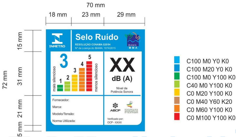
Quadro 1 – Padrão CMYK formador das cores, em %